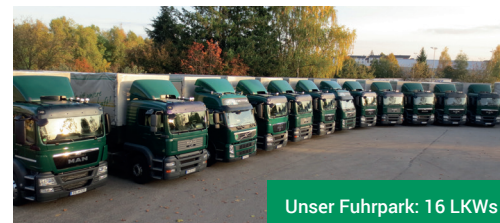
Unser Fuhrpark: 16 LKWs