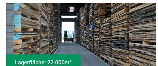
Lagerfläche: 22.000m 2