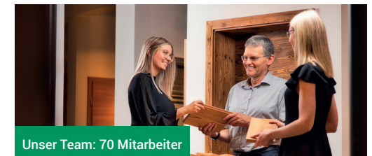
Unser Team: 70 Mitarbeiter